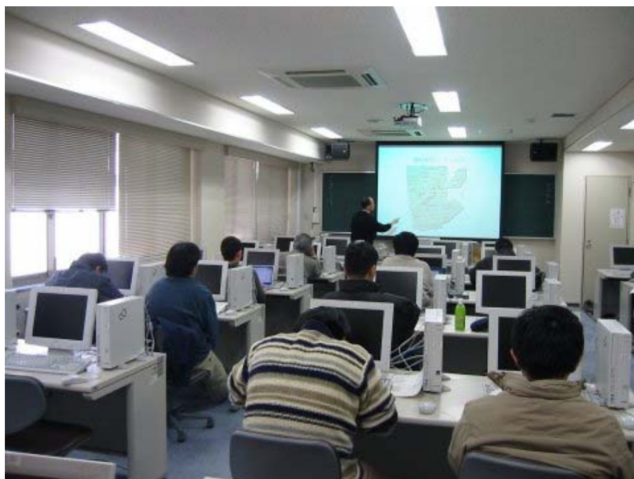
講習会風景 3 (学内無線 LAN 網の利用方法)