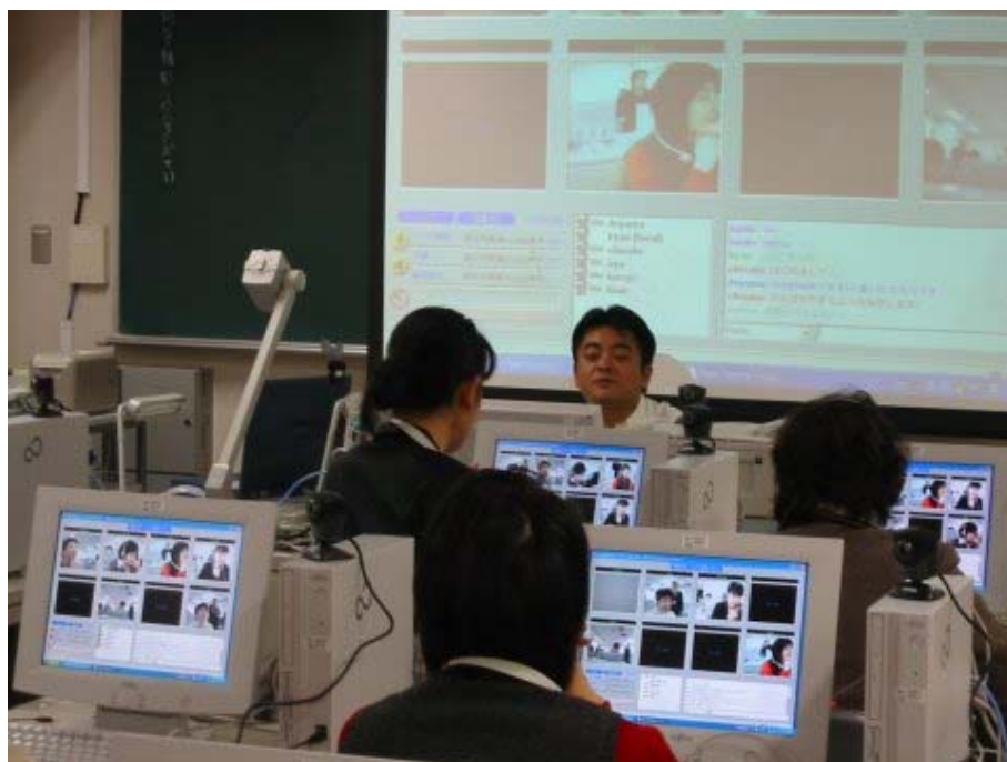
講習会風景 1 (テレビ会議システムの利用法)