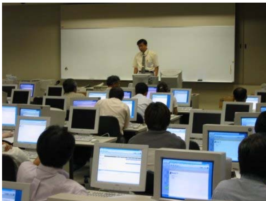
講習会風景 2 (e-Learning システム WebCT の利用方法)