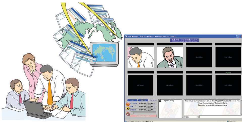
図 2: テレビ会議システムイメージ図

特徴1 ブラウザ上でテレビ会議ができます 日頃使い慣れているブラウザがそのままテレビ会議の画面になるため、誰でも簡単に操作できます。また、テレビ会議システムに必要なプラグインが自動でインストールされるため、設定に手間取ることはありません。