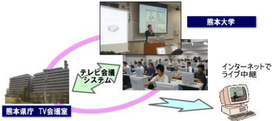
図 1: 地域貢献シンポジウムのリアル配信

テレビ会議用ソフトウェアは，Click To Meet Express for school と呼ばれるもので，熊本大学情報ネットワーク (KUIC) および熊本県総合行政ネットワーク (KSGN) の範囲でテレビ会議を行えるシステムです．Web ブラウザ*1 上でテレビ会議が簡単にできて，そのテレビ会議の予約もブラウザ上で可能です．本システムは，平成 14 年度地域貢献特別支援事業において，地域共同研究センターの「LINK ネットワーク窓口機能整備及び産学連携コーディネーション機能とのマッチング」事業によって導入されました．導入にあたっては総合情報基盤センターとして協力し，LINK サーバ群に含めたものです．テレビ会議システムと動画配信システムを連動して「地域貢献シンポジウムのリアルストリーミング配信」に利用した．図 1 その模様のイメージ図を示す．