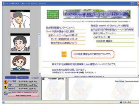
図 5: Web 共有機能のイメージ図

Web 共有機能 インターネットの Web 画面を共有しながらテレビ会議システムにより会話したり，調べ物を行うことができます。