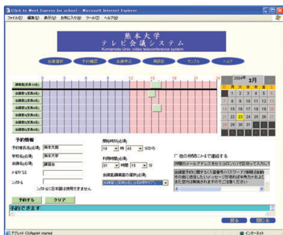
図 3: テレビ会議予約画面のイメージ図

特徴2 ブラウザ上でテレビ会議の予約ができます ブラウザから簡単にテレビ会議の予約ができるので、様々な会議に利用できる。Click To Meet Express for school のトップページから、簡単にスケジュールの調整、会議の時間帯等を登録し、会議参加者にその情報を電子メールを使って告知することができます。