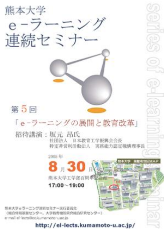
図4 作成したポスター

加えて、学内にポスターや立て看板を設置し、セミナーの告知や会場への誘導を行いました。