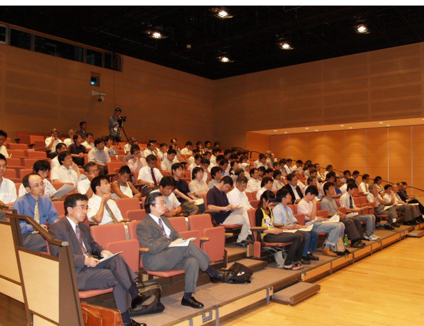
図1 セミナーの様子