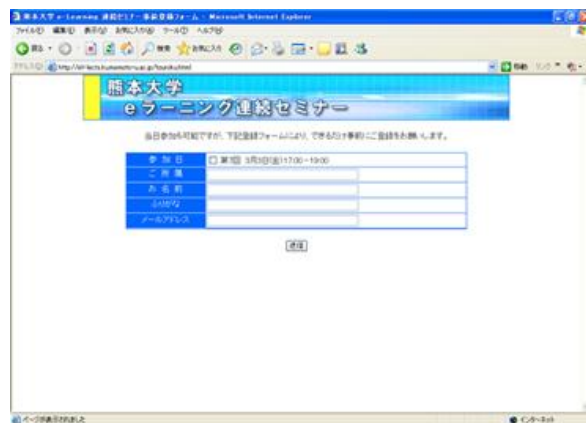
図7 セミナーの登録フォーム

Web ページには登録フォームがあり、事前にセミナーへの参加登録をさせていただきます。