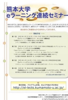
図2 配布したチラシ

県内の高等学校や、事前登録者に対して、チラシやメール、Web上でのセミナー開催のお知らせ等を行いました。