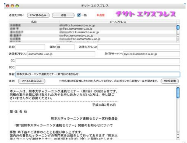
図3 開発したソフト「チサト エクスプレス」