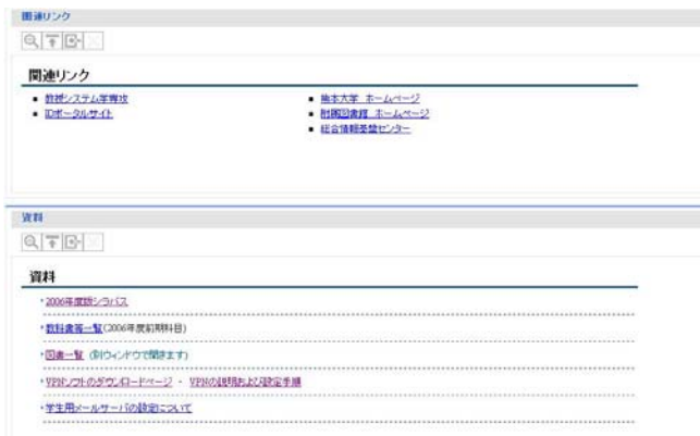
図 1 3 資料/リンク画面

2006 年度版のシラバスや教科書・図書一覧・VPN 設定などの情報を公開しています。