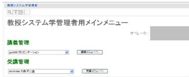
図5 管理者メインメニュー画面