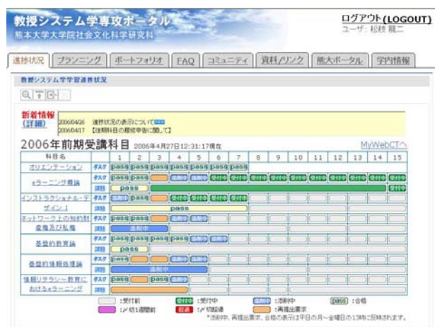
図 2 専攻ポータルのトップページ