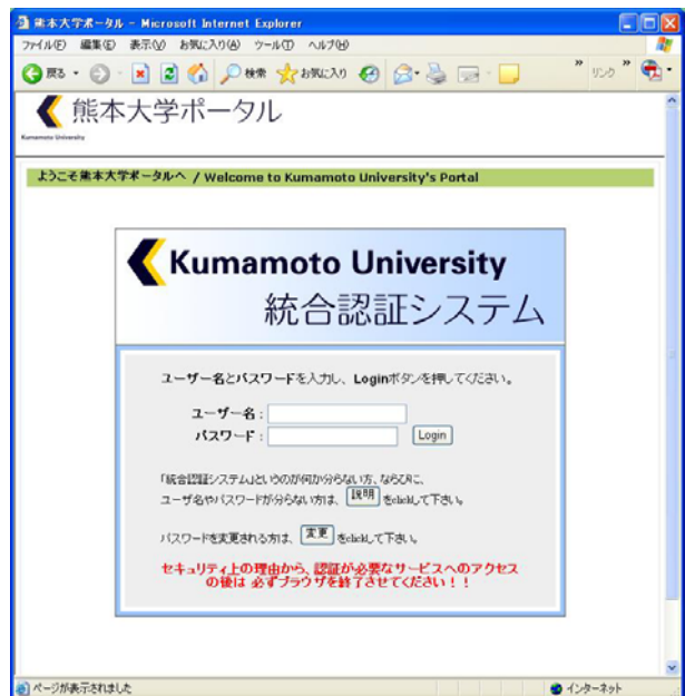
図 1 熊本大学ポータルサイトログイン画面