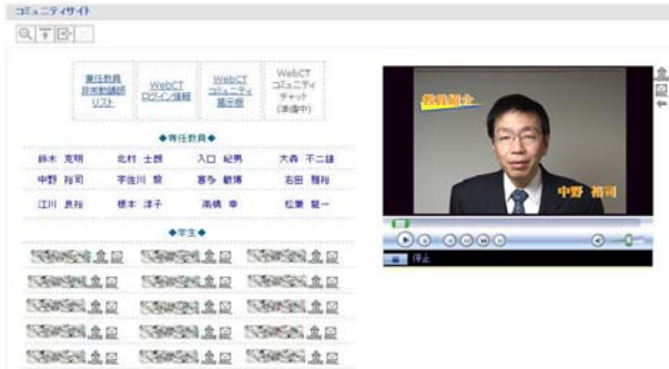
図 1 2 コミュニティ画面

オリエンテーション科目で作成した自己紹介 ホームページへのリンクとメールアドレス